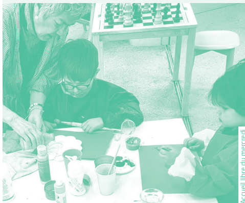
Accueil libre du mercredi

Nous avons à cœur de développer l'intergénérationnel afin que les personnes et les générations partagent et se rencontrent.