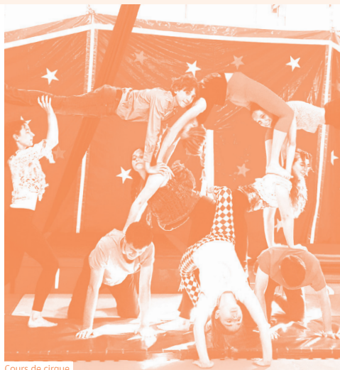
Cours de cirque

Tous les cours débutent la semaine du 11 septembre 2023