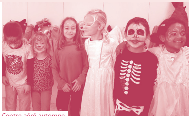
Centre aéré automne

Conférence suivie d'un apéro préparé par Rafaël Droz.