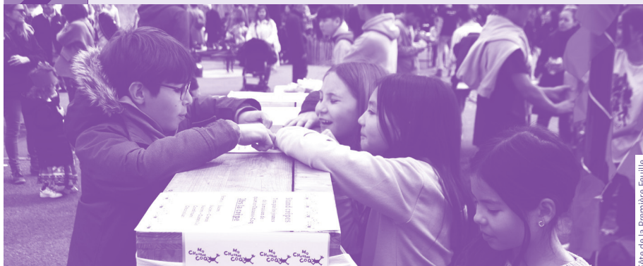
Fête de la Première Feuille